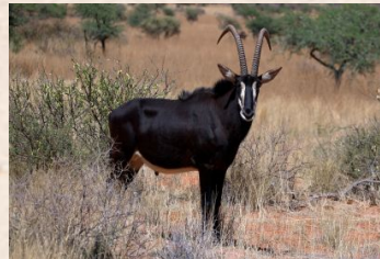
Sabel antilope (Afrika)