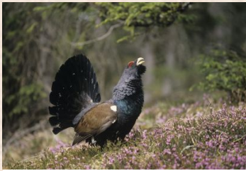
Tjur fugl, Western Capercaillie