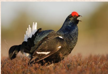
Urfugl, Black Grouse