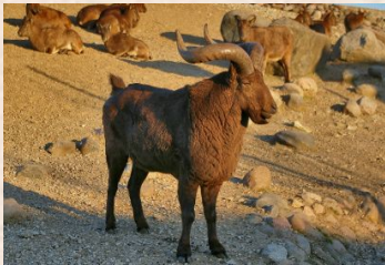
Tur, Østkaukasisk/Dagestan Tur