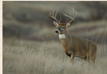
Whitetail deer/ Hvidhalet hjort