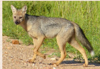
Sjagal, Side-stribed Jackal