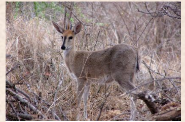
Duiker, Grey/Duiker, Grimm's (Common)