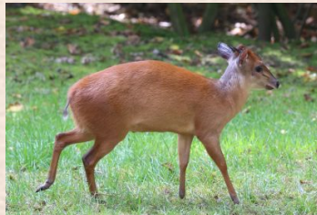
Duiker, Red/Rød dykkerantilope