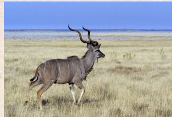
Kudu, Greater/Kudu, Stor