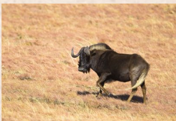
Hvidhalet gnu/Black Wildebeest