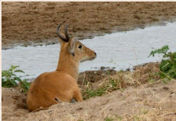
Rørbuk, Bohor/Reedbuck, Bohor