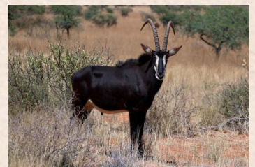
Sabel antilope (Afrika)