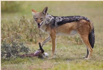
Sjakal, Skaberaksjakal/Black-backed Jackal