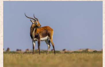
Red Lechwe/Black Lechwe/Kafue Lechwe/Moorantilope