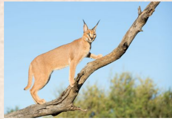
Ørkenlos, Caracal (Afrika)