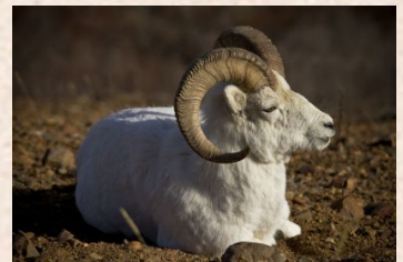
Dall Sheep/Stone Sheep