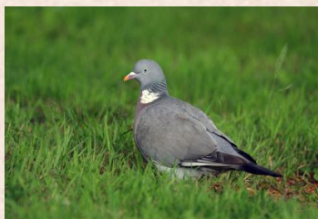
Due, Skov-/Due, Ring-