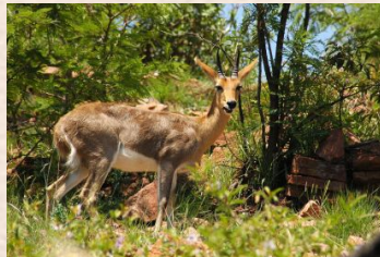
Rørbuk, Bjerg/Reedbuck, Mountain