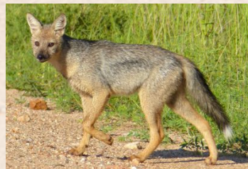
Sjagal, Side-stribed Jackal