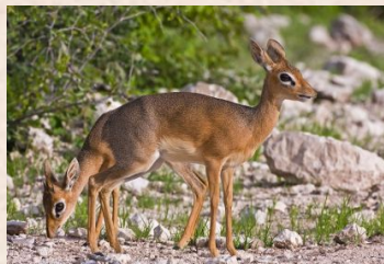
Dik Dik, Damara, Kirk's