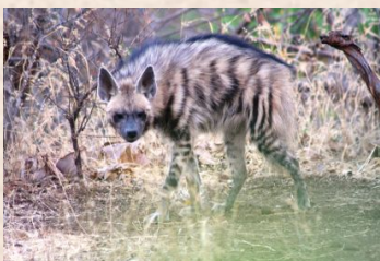
Hyæne, Stribet (Asien)