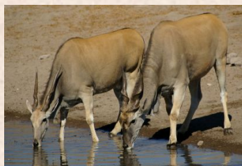
Eland/elsdyrantelope, Livingstone, Patterson's